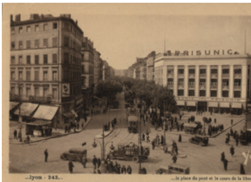
la place du pont et le cours de la liberté, période 1918-1945