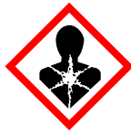
Risque grave pour la santé