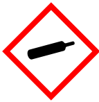
Gaz sous pression

Leur rejet au réseau d'assainissement, au réseau pluvial ou au cours d'eau est strictement interdit.