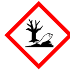
Dangereux pour l'environnement