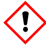
Dangereux pour la couche d'ozone et la santé

Pour préserver les milieux aquatiques, la réduction à la source est la meilleure solution. Devenez acteur de ce changement !