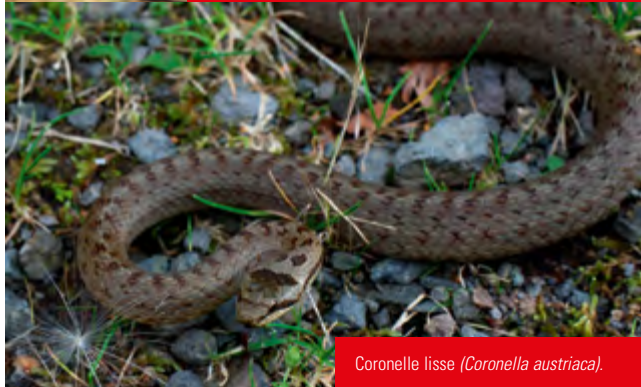
Coronelle lisse ( Coronella austriaca ).