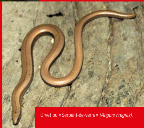
Orvet ou « Serpent-de-verre » ( Anguis fragilis ).

En juillet 2008, un agent du Grand Lyon a observé un lézard ocellé ( Timon lepidus ) dans un parking souterrain. Les mâles de cette espèce méridionale dépassent parfois les 60 cm !