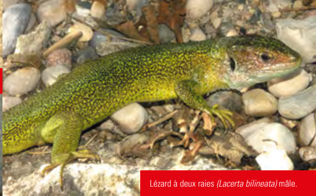
Lézard à deux raies ( Lacerta bilineata ) mâle.