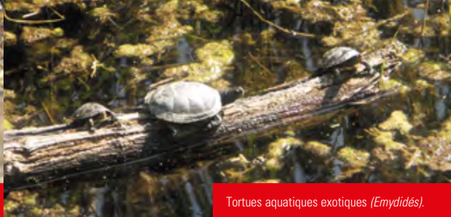
Tortues aquatiques exotiques ( Emydids ).