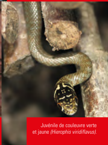
Juvenile de couleuvre verte et jaune ( Hierophis viridiflavus ).