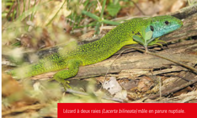
Lézard à deux raies ( Lacerta bilineata ) mâle en parure nuptiale.