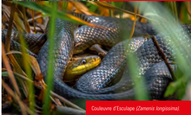
Couleuvre d'Esculape ( Zamenis longissima ).