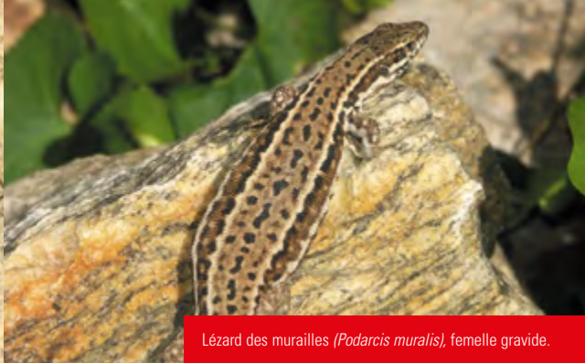
Lézard des murailles ( Podarcis muralis ), femelle gravide.