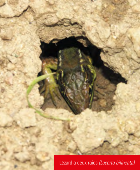
Lézard à deux raies ( Lacerta bilineata ).