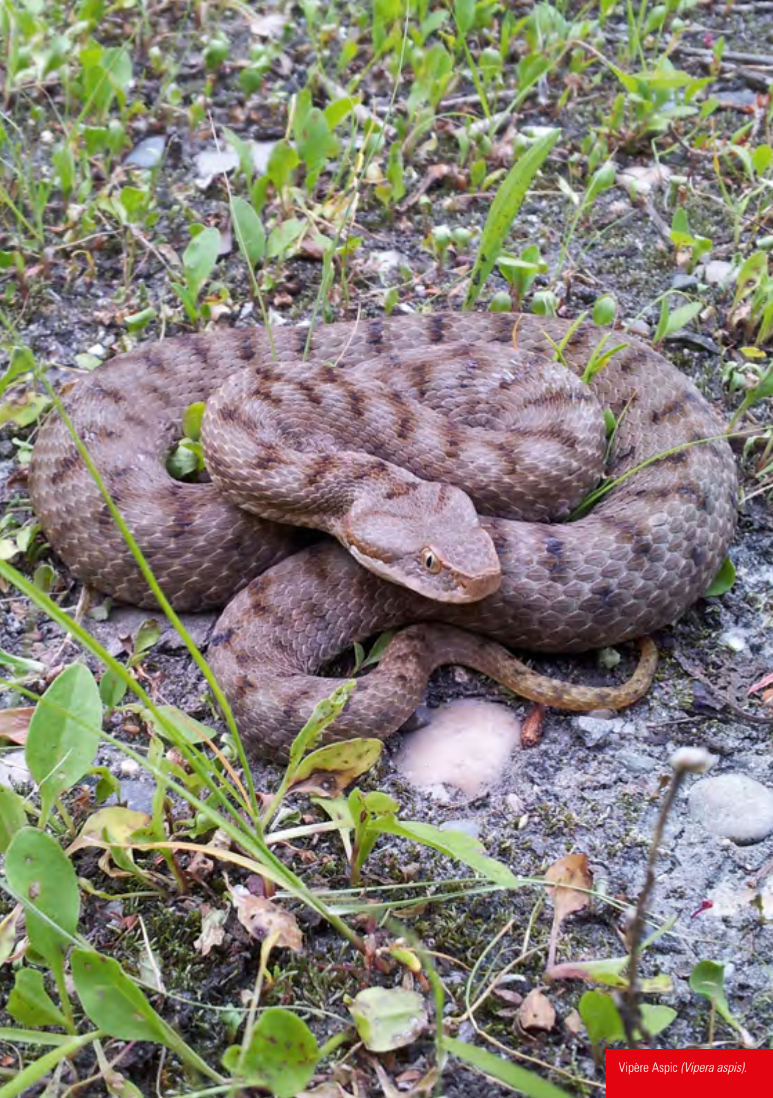
Vipère Aspique ( Vipera aspis ).