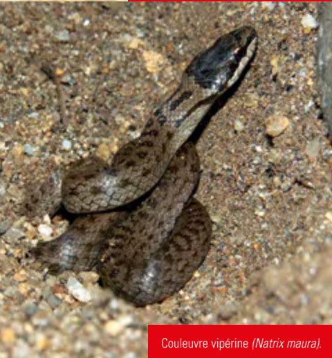
Couleuvre vipérine ( Natrix maura ).