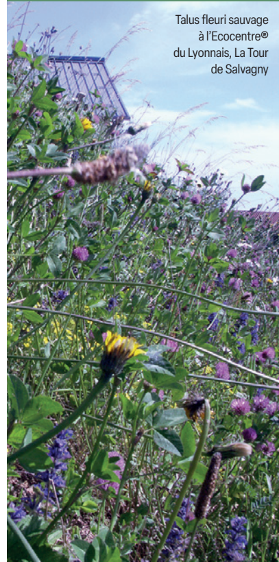
Talus fleuri sauvage à l'Ecocentre® du Lyonnais, La Tour de Salvagny

Pour éviter la fermeture du milieu et maintenir l'espace ouvert, il est nécessaire de faucher et d'exporter la matière (sous les haies par exemple) ou de faire pâturer une fois par an. La fauche peut avoir lieu en été, jusqu'en fin de saison ou même au printemps suivant. Idéalement, vous pouvez pratiquer des fauches partielles et décalées dans le temps et dans l'espace, ainsi la faune trouvera toujours refuge quelque part. Enfin, au-delà des zones les plus empruntées, relevez la hauteur de coupe (en particulier en été) entre 7 cm et 10 cm.