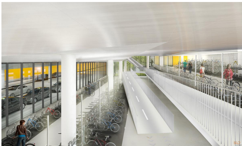
Le futur Park vélo'V Béraudier © Sud architectes