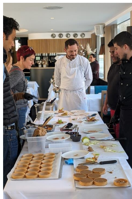
Atelier cuisine – Les bateaux lyonnais

Différents publics, ont ainsi pu pousser les portes d'une cinquantaine d'hôtels, de restaurants, de food court, de sites événementiels ou de centres de formation pour découvrir les nombreux métiers de la filière tourisme. Demandeurs d'emploi, jeunes collégiens ou lycéens, personnes en insertion ou en réorientation professionnelle, tous ont eu l'opportunité de passer derrière un comptoir et s'essayer à un atelier cocktail ou d'intégrer une brigade de cuisine dans de nombreux restaurants du territoire.