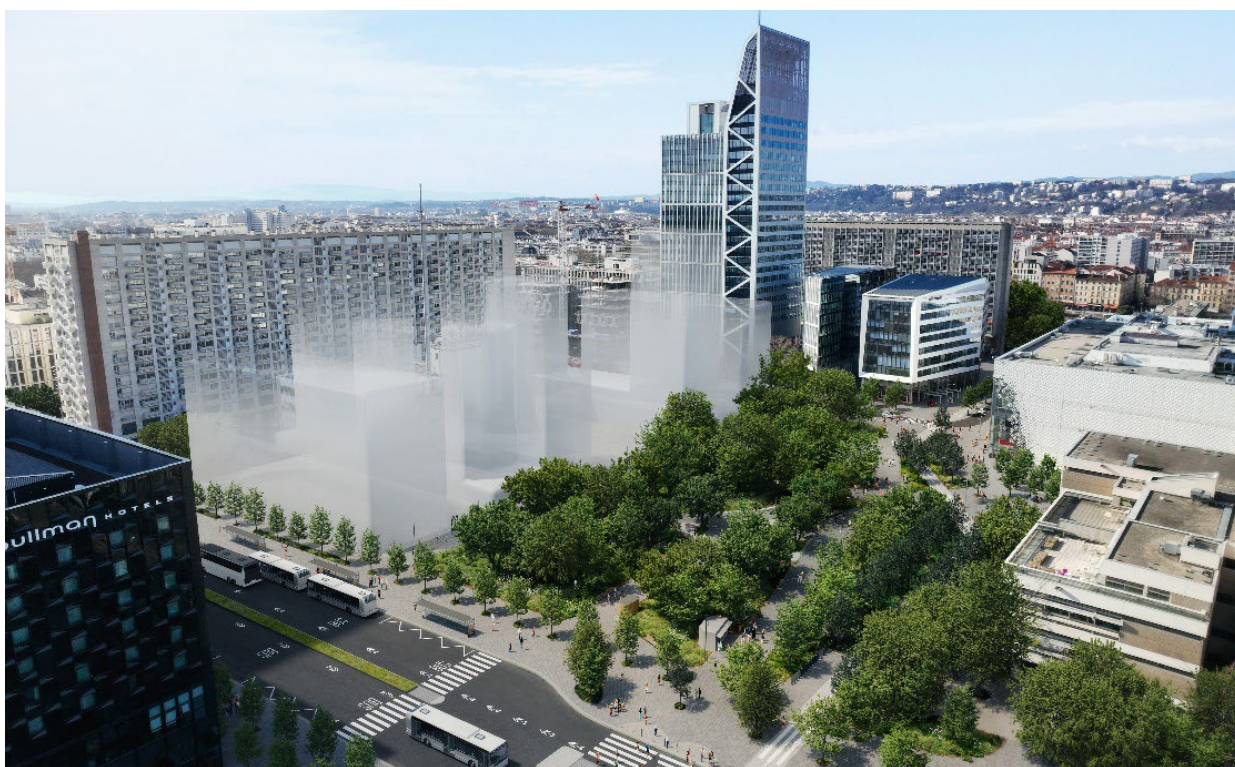
Vue globale sur le bois depuis la gare

« Le bois de la Part-Dieu sera demain l'emblème de la renaturation du cœur Part-Dieu, dans lequel toutes les strates de végétation seront multipliées. Cette renaturation amorce la création d'un paysage à l'échelle du quartier, accompagnant la transition écologique du quartier. La présence du végétal caractérise la conception des espaces publics, faisant du quartier un lieu de vie, généreux et apportant une réponse adaptée à la problématique des îlots de chaleur. De la même manière, le sol devient de plus en plus perméable, avec l'apparition de nouvelle matérialité ».