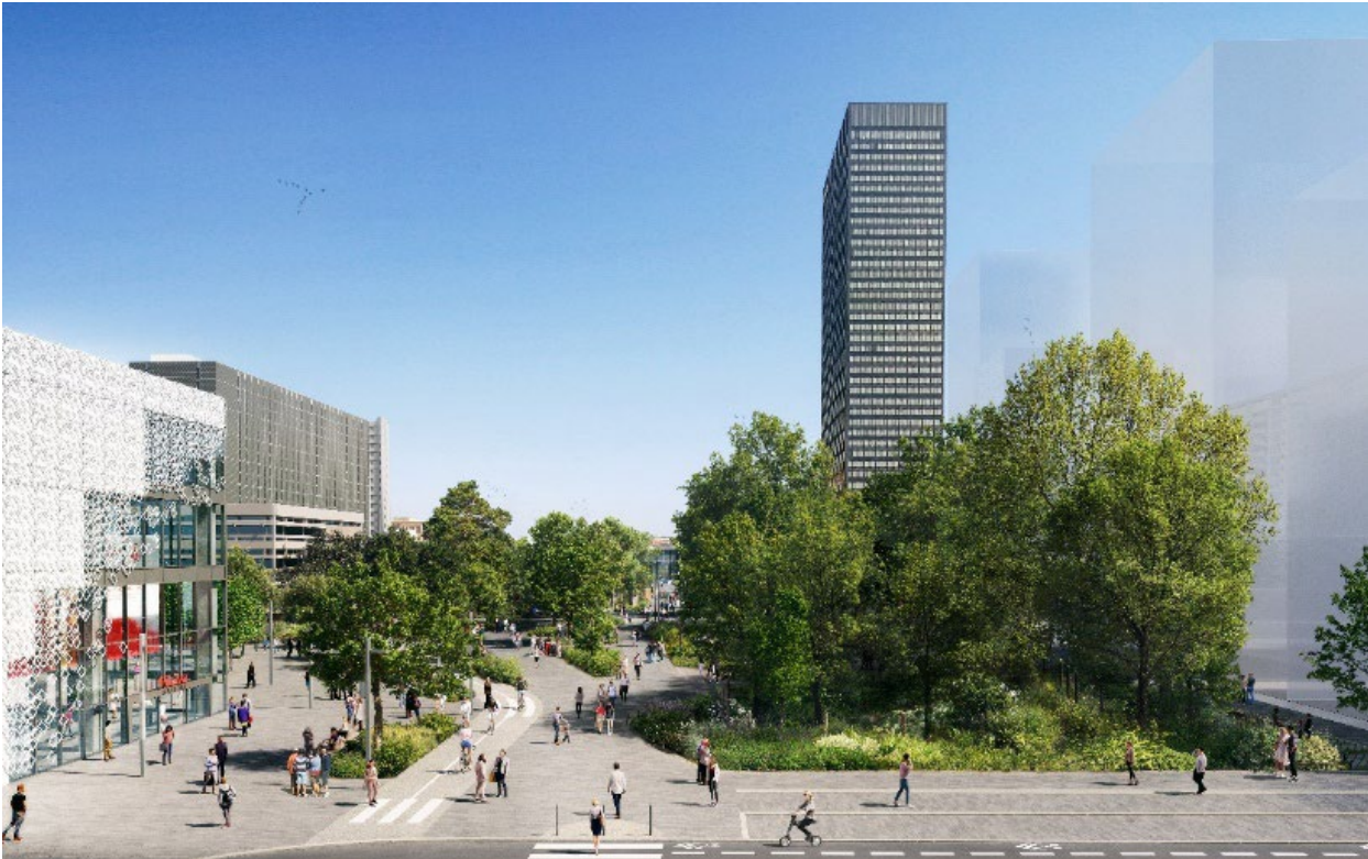
Vue du bois depuis la rue des Cuirassiers

Après un an d'études de conception et de concertation avec l'ensemble des usagers du quartier, menées par la SPL Lyon Part-Dieu, les grands principes du Bois de la Part-Dieu sont finalisés. Les travaux de cet espace public majeur, le long de la bibliothèque Part-Dieu et devant la gare de la Part-Dieu, vont démarrer à l'automne 2024.