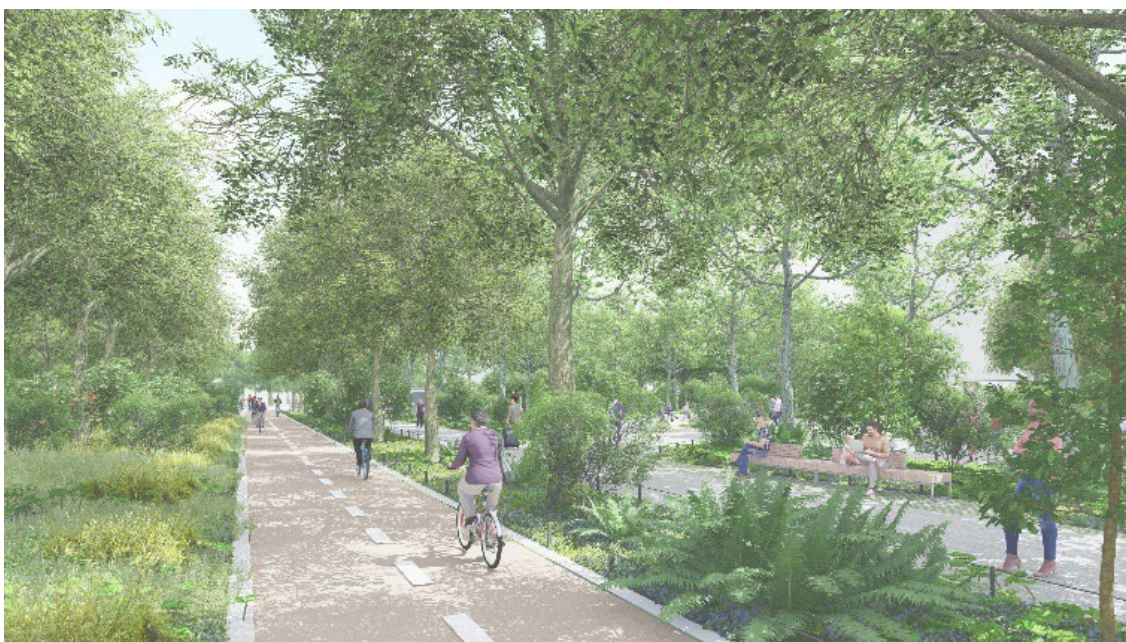
Vue de la future piste cyclable le long de la bibliothèque