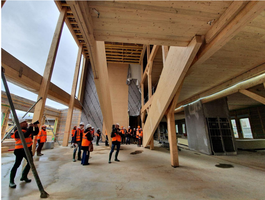
Photos de chantier du futur collège de Saint Priest, construit en ossature bois.

Deux collèges seront inaugurés cette année (à Saint-Priest et Villeurbanne) et vingt sont déjà en cours de restructuration.