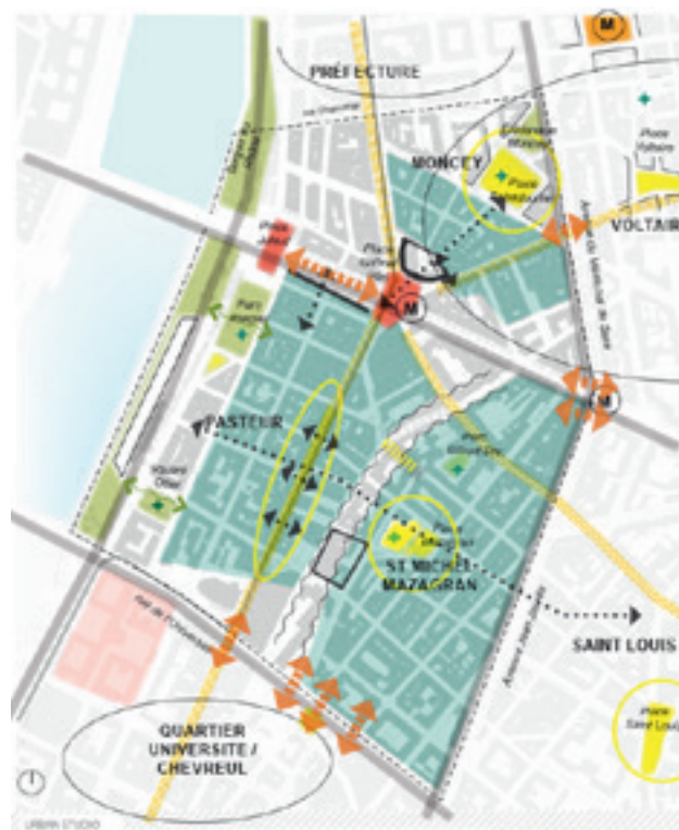
enjeux identifiés à l'échelle du quartier – diagnostic urbain