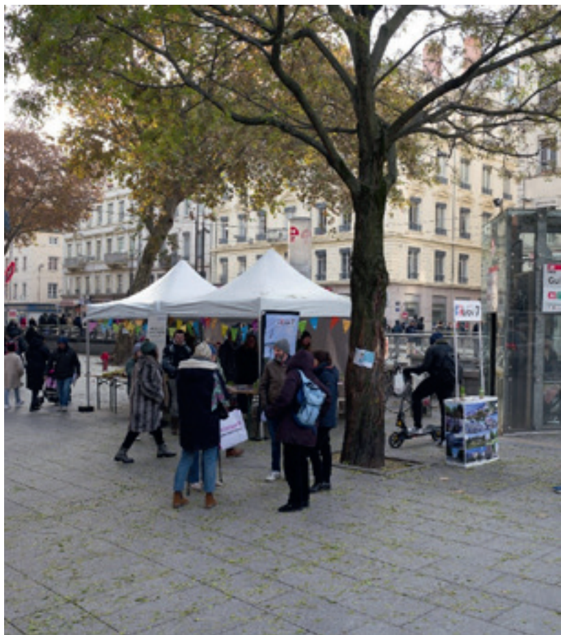
Animations sur la place Gabriel Péri

La Ville de Lyon permet aux habitants et aux commerçants de se réapproprier la place Gabriel Péri en organisant régulièrement des animations et des événements : la Voie est libre en 2021 et en 2022, soutien à l'évènement « Cours Gambetta, je m'amuse » organisé par des commerçants du quartier en mai 2022, soutien à l'action « décorations de Noël de la place Gabriel Péri » organisée par des habitants en lien avec une centaine d'enfants des écoles primaires Gilbert Dru, Saint-André et Cavenne en décembre 2022.