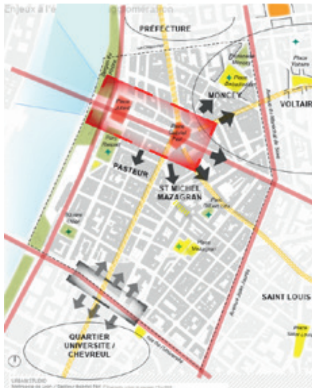
enjeux identifiés à l'échelle de l'agglomération