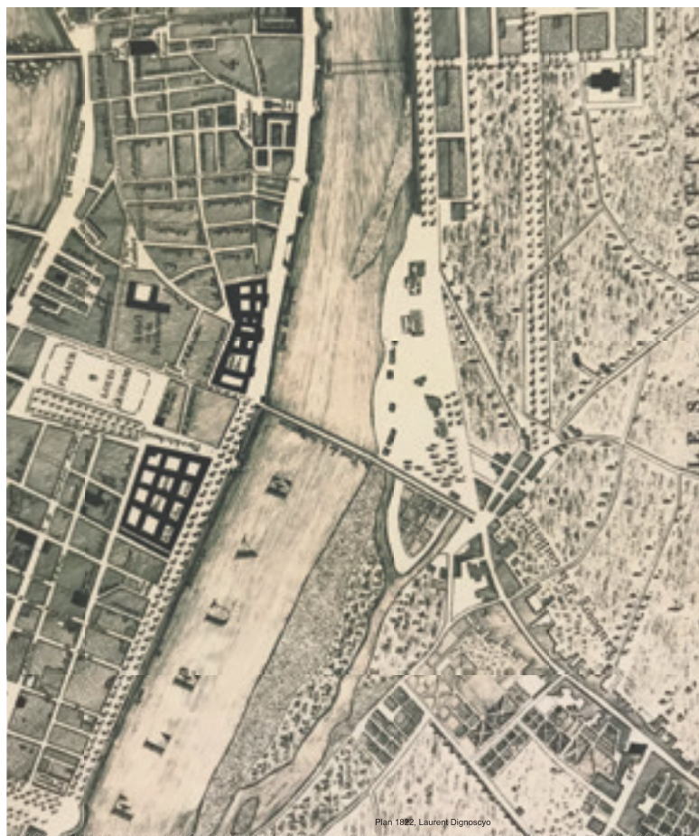
Plan de 1822