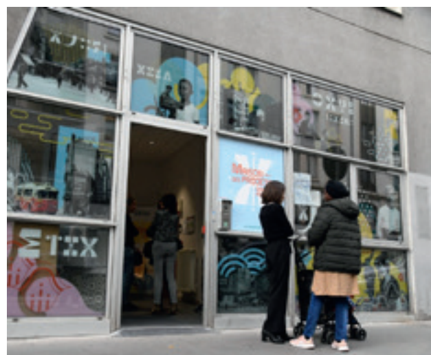
la maison des projets

votes comptabilisées sur les premiers aménagements proposés