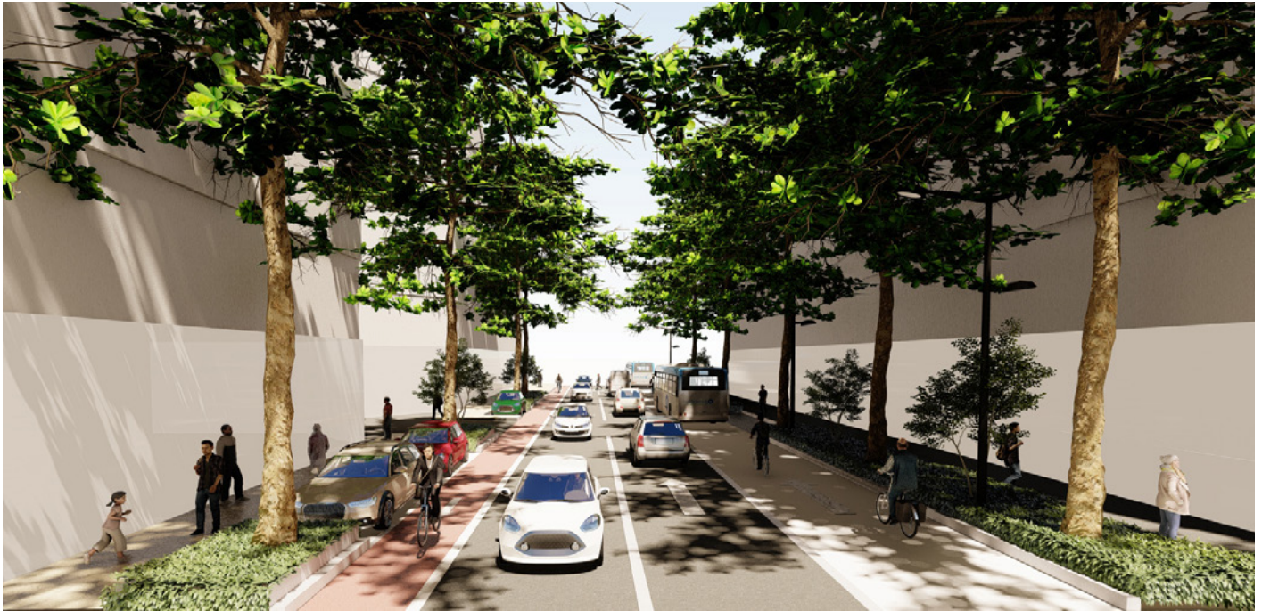
vue projetée de l'avenue Salengro requalifiée