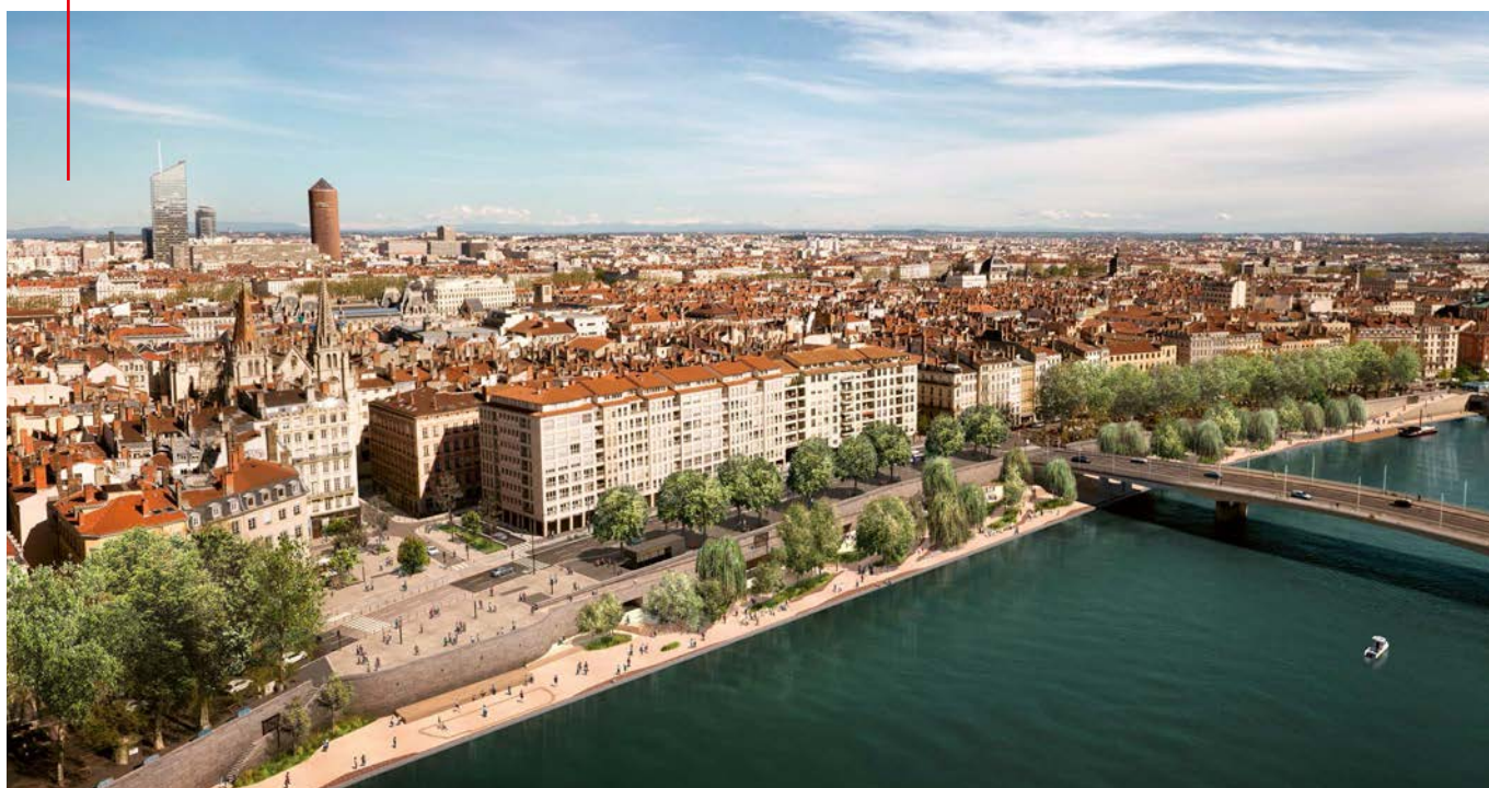
Le parking Saint-Antoine, construit en béton dans les années 1970, laissera place à un vaste jardin.

Face à la colline de Fourvière, entre l'église Saint-Nizier et la rue Grenette, le projet des Terrasses de la Presqu'île permettra de redécouvrir un vaste espace public au bord de l'eau. Un jardin fluvial de 8 500 m 2 sera aménagé sur l'ancien bas-port, à la place du parking Saint-Antoine reconstruit juste à côté, sous le quai. La promenade du quai Saint-Antoine, les places Saint-Nizier et d'Albon seront également complètement réaménagées.