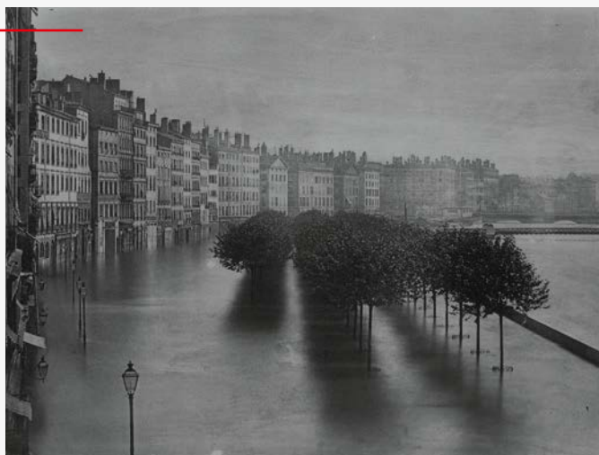
Le quai sous les eaux de la Saône lors de la crue de 1856. Vue depuis un immeuble du quai Saint-Antoine au niveau de la rue Dubois, en direction du sud - d'après un cliché de Louis Froissart, conservé aux Archives municipales de Lyon.

En 1856, la Presqu'île est submergée, plusieurs ponts sont emportés et les dégâts sont nombreux.