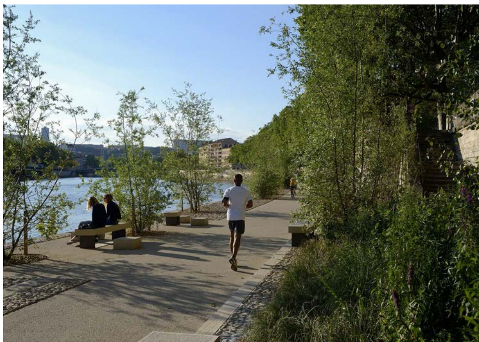
Les Rives de Saône ouvertes en 2013, sur la promenade du bas-port Gillet.