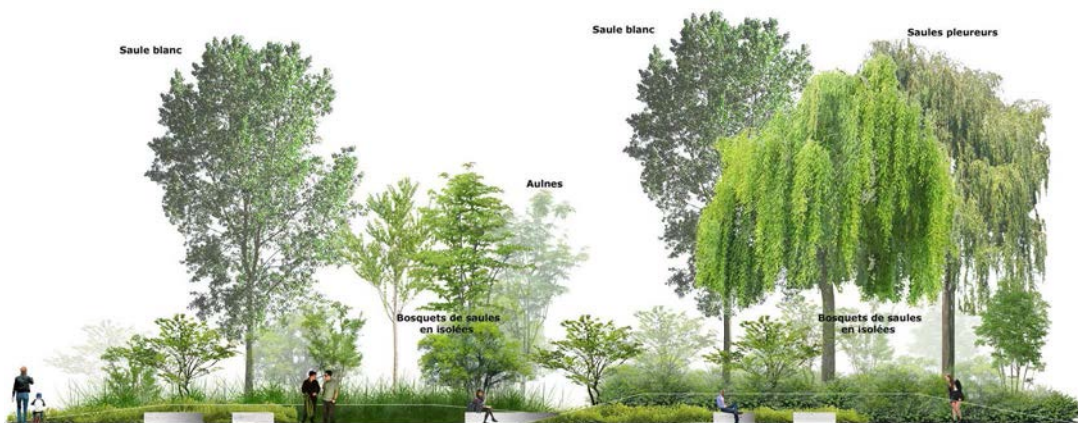
La végétation et les îles du futur jardin sont conçues pour résister aux crues de la rivière.

Créer un jardin le long de la Saône en plein cœur de Lyon constitue un véritable défi. Chaque année, la rivière déborde et inonde ses rives. Face à ces débordements, l'aménagement des rives de la Saône implique de s'adapter avec intelligence à la rivière.