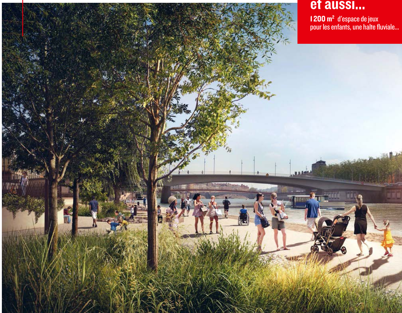
Le futur jardin fluvial des Terrasses de la Presqu'île.