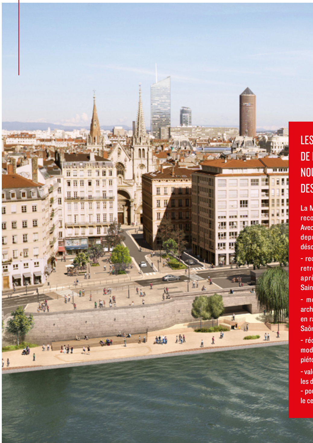
La future place d'Albon et l'église Saint-Nizier vues depuis la colline de Fourvière