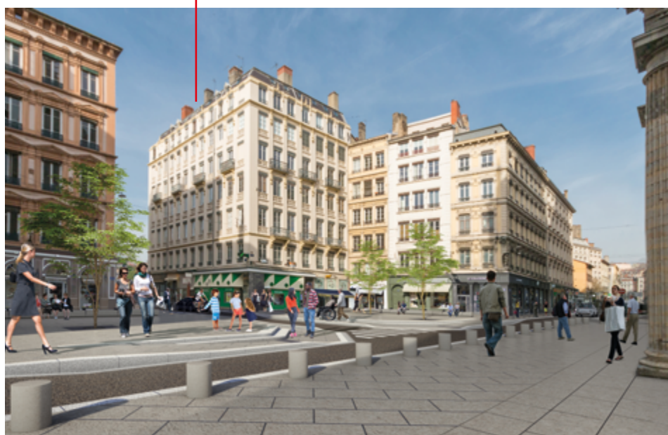
La future place Saint-Nizier et son parvis devant l'église

DE MARS 2019 À FIN 2022, C'EST TOUTE LA FAÇADE OUEST DE LA PRESQU'ÎLE QUI SERA PROGRESSIVEMENT TRANSFORMÉE.