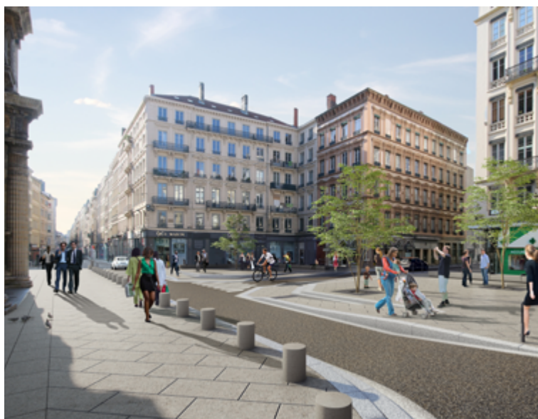
La future place Saint-Nizier, après les sept mois de travaux

À terme, les bords de Saône auront été totalement transformés, et chacun, chacune pourra profiter d'un vaste jardin fluvial au bord de l'eau !