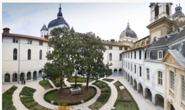
La cour du cloître, future entrée de la Cité Internationale de la Gastronomie

Devenir une vitrine de l'excellence culinaire française et internationale et attirer le grand public : voilà le double enjeu de la Cité Internationale de la Gastronomie, qui ouvre ses portes à l'automne 2019 au sein du Grand Hôtel-Dieu. Le public ? Petits et grands, touristes, habitants, mordus de cuisine ou néophytes. Bien manger et mieux se nourrir pour être en bonne santé, découvrir les secrets de la gastronomie du monde, les traditions, les tendances actuelles et émergentes... Voici ce qui attend les visiteurs au fil d'une déambulation ludique et rythmée !