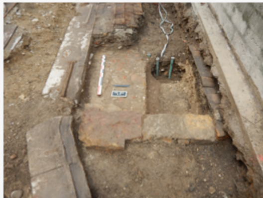
Les traces des fondations de boutiques qui longeaient l'église

Les sondages archéologiques réalisés en 2018 sur la place Saint-Nizier et la rue de la Fromagerie ont révélé :