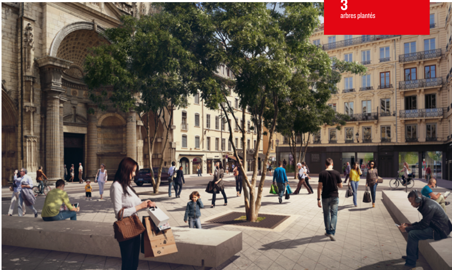
La future place Saint-Nizier, un lieu de repos face à l'église