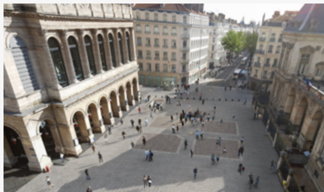
La place de la Comédie suite aux travaux d'embellissement

Dix espaces publics emblématiques du centre de Lyon font peau neuve. Réalisé par la Métropole et la Ville de Lyon, le projet Cœur Presqu'île se poursuit en 2019. Après des travaux d'embellissement place de la République et place Louis Pradel en 2018, les interventions se poursuivent cette année sur cette dernière, mais aussi du côté de la place Chardonnet, la place de la Comédie, la place des Terreaux, la place Tolozan, la rue de la République, la rue Victor Hugo et la place Ampère. Cette 1 re étape de Cœur Presqu'île sera terminée au printemps prochain.