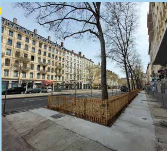
Le Cours Gambetta fin mars 2024