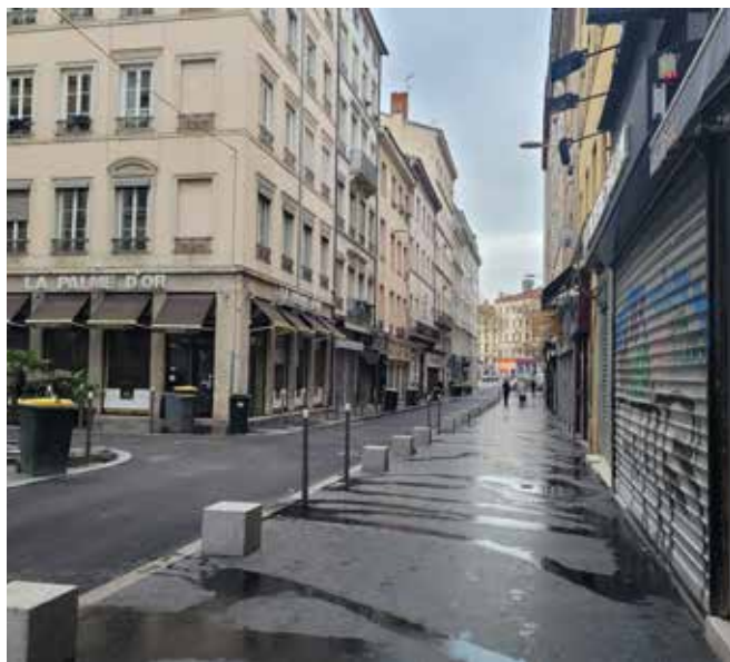
Rue Paul Bert fin mars 2024

Les travaux se termineront prochainement sur la rue Paul Bert. Les trottoirs ont été élargis et sécurisés avec des bornes de granit. Les dernières finitions sont en cours avec la pose d'un revêtement de couleur claire sur les passages piétons surélevés au niveau des intersections avec les rues Moncey, Lacroix, Bonnefoi et Villeroy. Le marquage au sol du contre-sens cyclable rue Paul Bert sera prochainement réalisé et l'insertion des cycles sur le carrefour Gambetta sera facilitée et sécurisée par un feu tricolore. Des corbeilles de propreté vont également être installées.