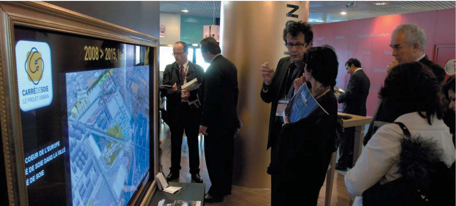
Salon MIPIM – maquette interactive du projet urbain