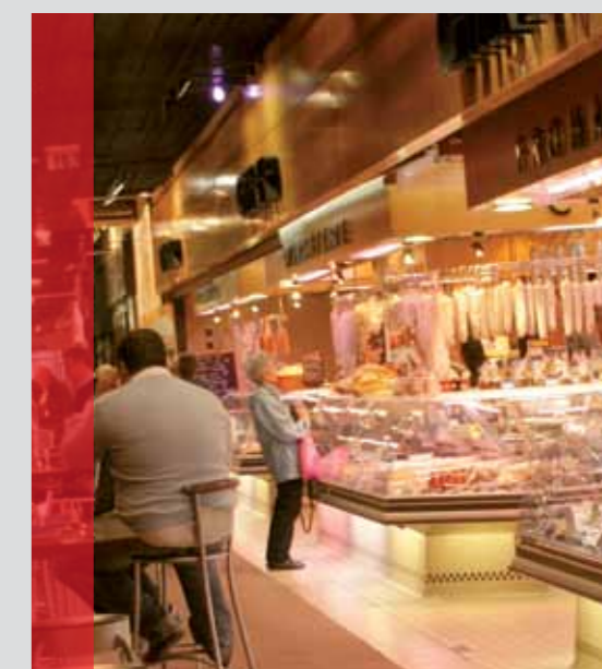
La rénovation de la rue Garibaldi va ouvrir les Halles Paul-Bocuse au quartier et à la ville.

Les Halles de Lyon, 102, cours Lafayette, Part-Dieu, Lyon 3 e .