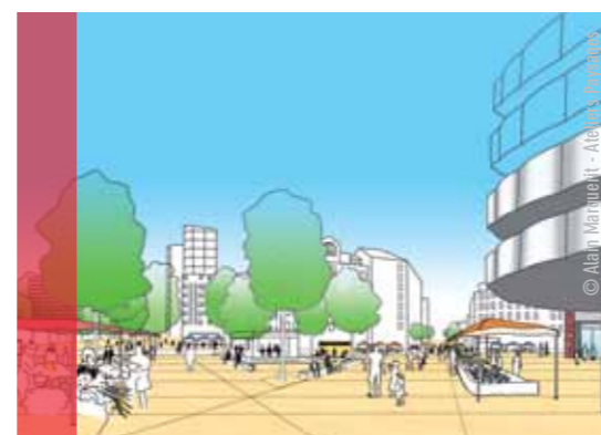
Une véritable esplanade va être aménagée au niveau des Halles Paul-Bocuse.

Il faut "serpenter" pour accéder à l'Auditorium et "contourner" pour entrer à la piscine ! Chaque bâtiment, public ou privé, va faire l'objet d'un traitement ad hoc . Plus généralement, l'accès aux bâtiments de la rue Garibaldi se résume en un principe simple et formel : une mise à niveau du sol, une visibilité absolue et un accès privilégié.