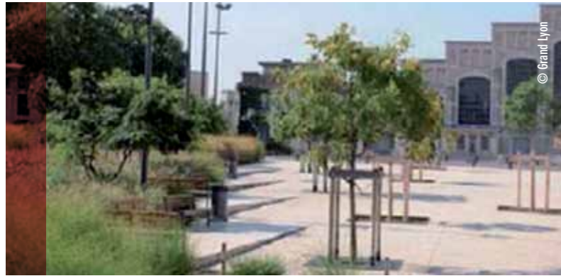
Exemple de place minéralisée arborée Place des Docteurs Mérieux – Lyon 7.

UN ÎLOT DE CHALEUR DÉSIGNE LES SURFACES URBAINES, SOUVENT NON VÉGÉTALISÉES ET REVÊTUES DE MATÉRIAUX SOMBRES, QUI ACCUMULENT LA TEMPÉRATURE LE JOUR ET LA RESTITUE LA NUIT TOMBÉE.