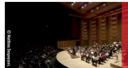
L'orgue Cavallé-Coll | Gonzalez dans la salle de l'Auditorium.