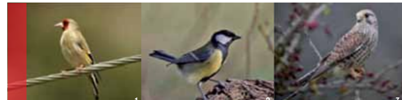
Le Chardonneret élégant (1), la Mésange charbonnière (2) ou le Faucon crécerelle (3) sont quelques-unes des nombreuses espèces d'oiseaux recensées le long de la rue Garibaldi.

pollens sur les promeneurs printaniers, les essences végétales les moins allergisantes seront utilisées (châtaignier, noyer, charme, houblon...). Les arbustes délimiteront les voies de circulation. Leur hauteur sera limitée à 1,40 mètre et s'abaissera davantage aux carrefours, pour assurer une meilleure visibilité aux piétons comme aux conducteurs. À terme, des jardins sur dalles (devant le Grand Lyon) ou de plain-pied (devant la cité administrative) compléteront la promenade arborée, et viendront adoucir la ligne de façades. La superficie actuellement occupée par la végétation sur le site doit être multipliée par trois pour atteindre 13 400 m 2 . La nouvelle rue Garibaldi tracera une belle "ligne verte" dans le centre-ville !