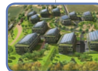
ZAC DES GAULNES