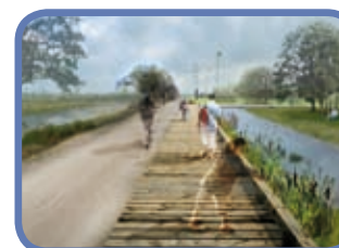
BERGES DU CANAL DE JONAGE