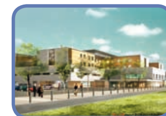
PÔLE SANTÉ MUTUALITÉ