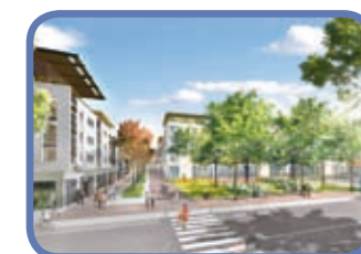
ZAC DE LA FRATERNITÉ DÉCINES CENTRE