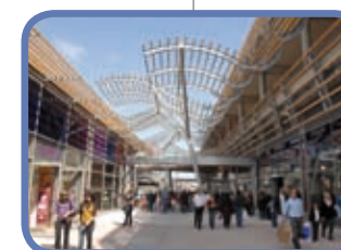
PÔLE COMMERCIAL CARRÉ DE SOIE