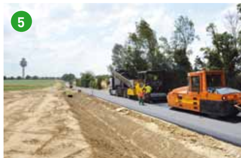
5 Le chemin de Meyzieu et sa nouvelle piste cyclable qui permettra à terme de relier Chassieu au Grand Large