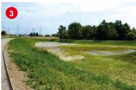
3 Le nouveau bassin Voltaire, qui permet la rétention des eaux pluviales et limite ainsi les risques d'inondation sur le secteur