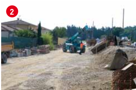
2 La construction du mur de soutènement sur la rue Michel Servet