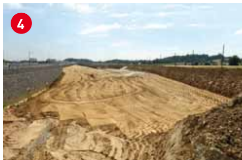
4 Le futur bassin Marceau, en cours d'aménagement