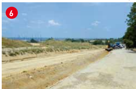
6 Les travaux de création du site propre pour les navettes bus événementielles à Chassieu