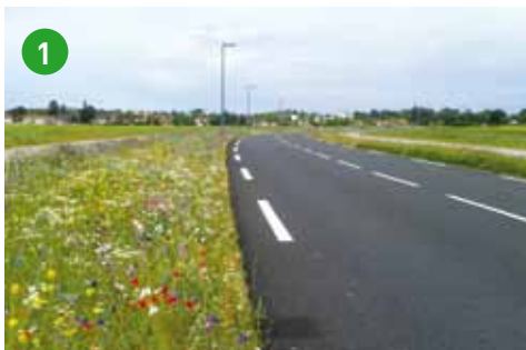
1 La rue Elisée Reclus requalifiée, le long du V-Vert à Décines