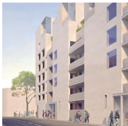
▲ Perspective du projet de l'îlot J

52 logements aux surfaces confortables et bénéficiant de beaux espaces extérieurs seront proposés sur l'îlot J. Ces appartements, dont la plupart seront traversants, s'inscriront dans l'esprit des appartements des Gratte-Ciel avec des espaces intérieurs optimisés.