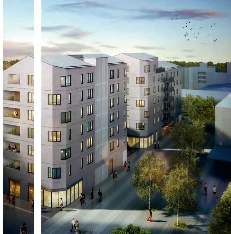
▲ Perspective du projet de l'îlot I

« CE QUI NOUS GUIDE POUR CE PROJET, C'EST LE RESPECT DE LA QUALITÉ DES GRATTE-CIEL EXISTANTS, TOUT EN Y APPORTANT DE LA MODERNITÉ. »