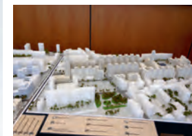
▲ Maquette du projet

Élément phare de la médiation : la maquette du projet urbain. En réduction 1/500°, elle donne à voir l'ampleur du quartier en construction et permet à chacun de s'y repérer et de mesurer son inscription dans les Gratte-Ciel existants. La maquette est entourée de 12 panneaux d'exposition qui évolueront au rythme de l'avancement du projet. L'exposition inaugurale propose une mise en regard entre le quartier historique des Gratte-Ciel et le projet en cours de réalisation. Un coin bibliothèque, associé à un petit salon de lecture et à un poste de consultation numérique, permet aux visiteurs d'approfondir cette découverte du quartier.