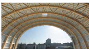
Toiture en dôme de la salle haute