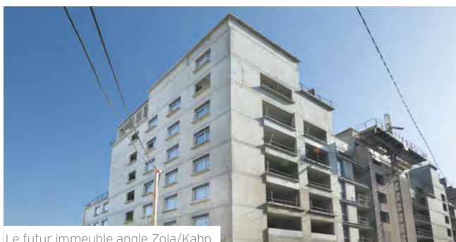
Le futur immeuble angle Zola/Kahn

Les 52 logements de la résidence Neopolis (îlot J), dessinée par l'atelier Régis Gachon Architectes et réalisée par le promoteur UTEI, seront livrés progressivement à partir de cet été. Elle sera dotée d'une terrasse collective et d'un jardin potager pour les habitants. Un espace commun au sein de l'immeuble sera mis à la disposition des résidents pour diverses activités : ateliers, anniversaires, etc.