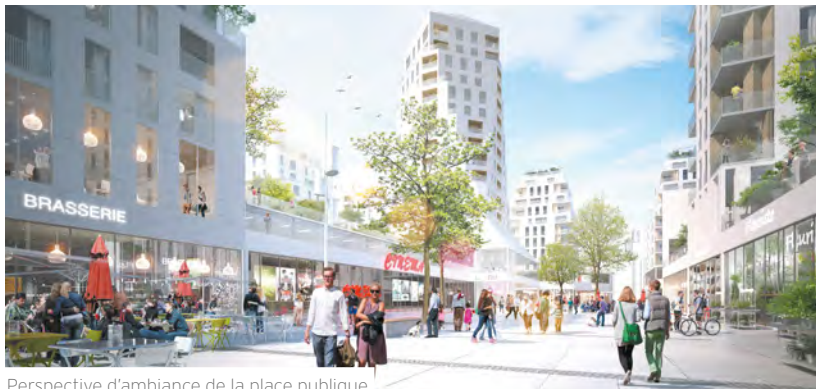
Perspective d'ambiance de la place publique

Le projet Gratte-ciel centre-ville prévoit l'aménagement de nouveaux espaces publics essentiels à la vie des habitants, propices à la rencontre et l'échange.