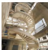
Escalier intérieur central qui relie les 3 niveaux