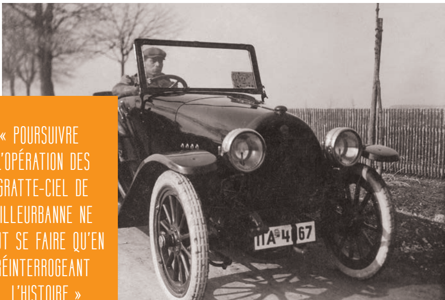
▲ Peugeot type 163

La nouvelle histoire qui s'écrit pour Gratte-Ciel centre-ville prend ses racines dans le quartier historique.