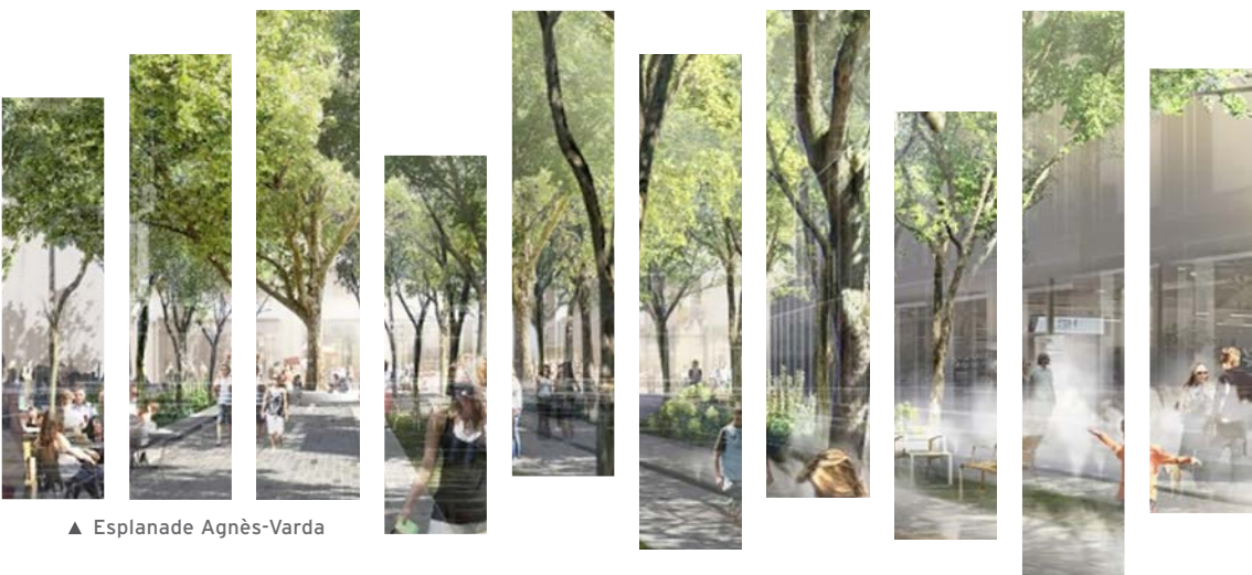
▲ Esplanade Agnès-Varda