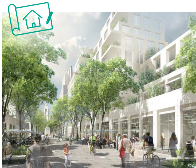
▲ L'avenue Henri-Barbusse prolongée

DEUX DES PRINCIPAUX AXES DU QUARTIER, L'AVENUE HENRI-BARBUSSE ET L'ESPLANADE AGNÈS-VARDA, SERONT ENTIÈREMENT PIÉTONS.