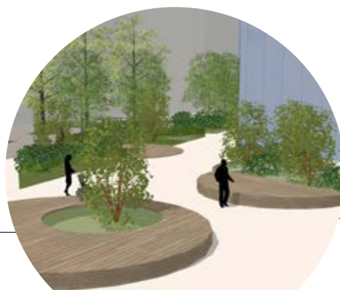
Parvis du Quartz

De larges assises en bois autour de plantations résistantes à la chaleur vont être installées. L'espace sera plus agréable pour faire une pause, notamment pour les employés, nombreux dans cette partie du cours Émile-Zola.