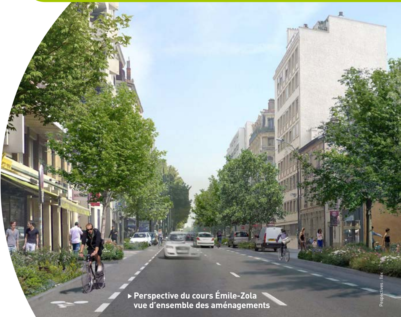
► Perspective du cours Émile-Zola vue d'ensemble des aménagements

L'objectif est d'apaiser cet axe traversant de Villeurbanne, pour offrir à tous les usagers, un meilleur partage de l'espace et un cadre de vie plus agréable.