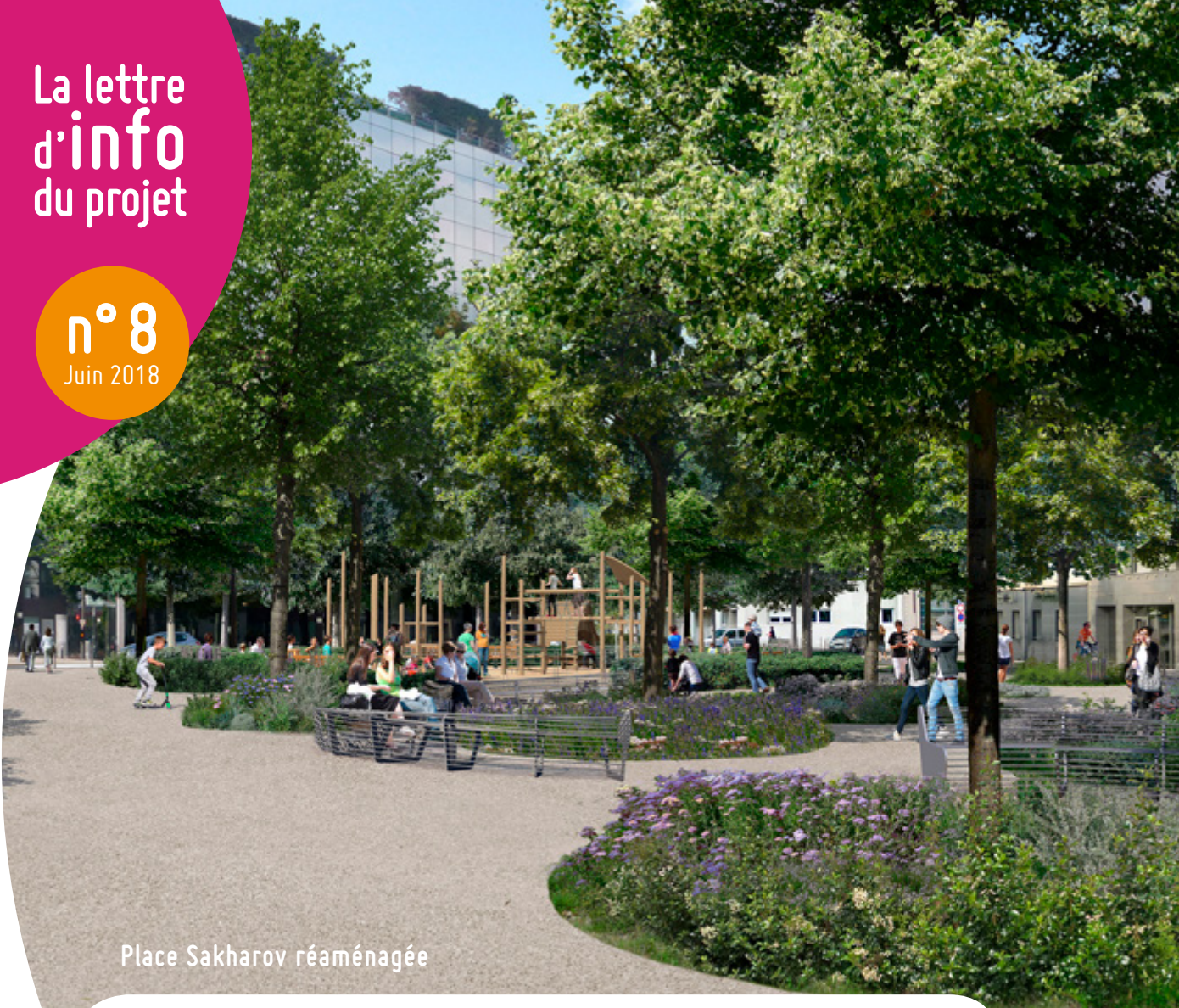
Place Sakharov réaménagée