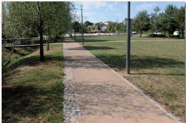
Corbas - Parc Bourlione

Oui, en fonction du type de sable utilisé.