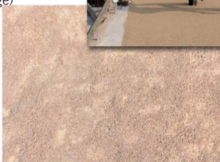
Lyon 7ème - Pl. des Docteurs Mérieux

La stabilisation du sablé est essentielle. Elle est toujours réalisée mécaniquement à l'aide d'un compacteur. Elle est cependant peu durable. Pour pallier son manque de pérennité, on peut lui ajouter un liant. On distingue alors deux familles de matériaux : les sables stabilisés mécaniquement et les sables stabilisés avec un liant. Dans le cas de l'utilisation d'un liant minéral comme la chaux ou le ciment (gris, clair ou blanc) dosés à 5% ou d'un liant synthétique comme la résine époxy, le sablé perd une partie de sa qualité de pulvérulence. Il pourra alors supporter d'autres usages.