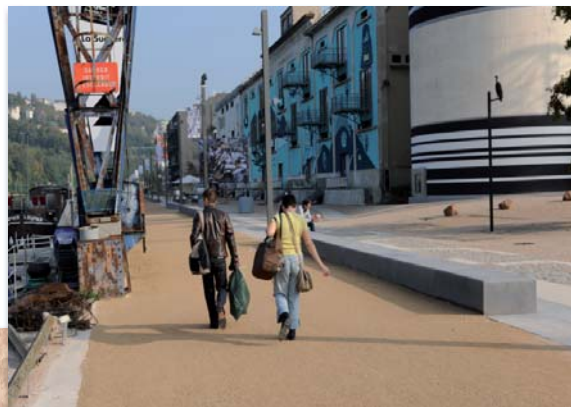
Lyon 2ème - Quai Rambaud la Sucrière