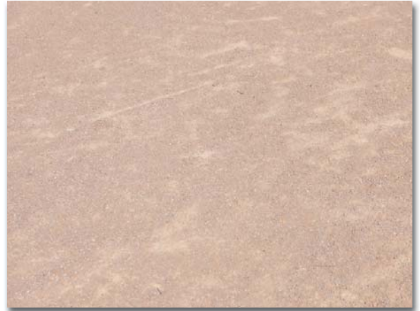
Lyon 7ème - Parc de Gerland

Afin de limiter au maximum l'apport de sable dans les réseaux d'assainissement, la mise en œuvre de ce revêtement nécessitera pour la gestion