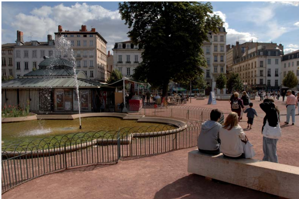
Lyon 2ème - Place Bellecour

Économiques et de mise en œuvre rapide, les sables stabilisés mécaniquement seulement ou avec un liant sont cependant moins pérennes que les matériaux liés ; ils doivent être entretenus fréquemment afin d'éviter au maximum le tassement ou l'orniérage sur les lieux de fort passage. On les rencontre souvent sous le nom de Ghorre ou encore de «sablé» pour le sablé stabilisé mécaniquement et de «stabilisé» pour le sablé stabilisé avec un liant. La problématique des espaces canins ne sera pas traitée ici.