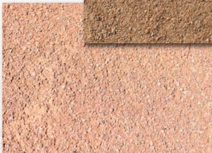
Pierre Bénite - Hôpitaux Sud