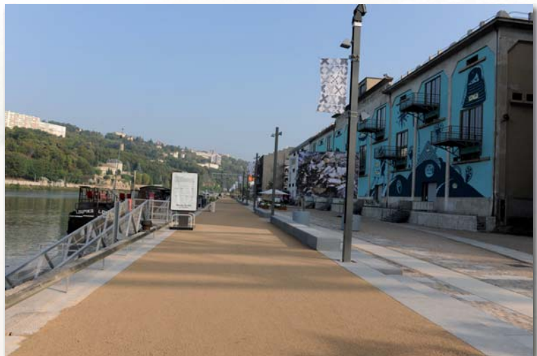
Lyon 2ème - Port Rambaud

Le remplacement du matériau s'opère sans difficulté particulière. Il est rapide et peu onéreux. On procède tout d'abord à l'enlèvement du revêtement en place, à un rajout de sable mélangé avec un liant puis à un nouveau compacté.