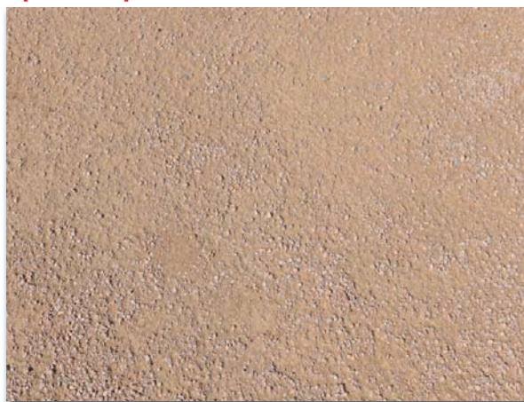
Corbas - Parc Bourlione

Une attention toute particulière sera portée à l'homogénéité du mélange sous peine de voir le matériau se comporter comme un sablé stabilisé