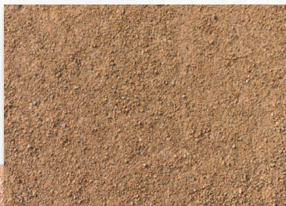
Lyon 2ème - Quai Rambaud la Sucrière

Le choix du liant impacte nécessairement la tenue du matériau et peut aussi avoir une incidence sur la couleur définitive du revêtement. On choisira le liant en fonction de sa couleur et des qualités techniques du sable.