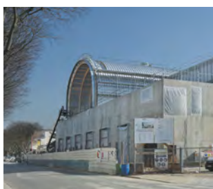
Photo du chantier - mars 2019

En septembre prochain, le complexe sportif municipal polyvalent de 3 000m 2 sur 3 étages réalisé par l'agence ANMA viendra compléter l'offre sportive de la ville. Ouvert sur le quartier avec son parvis d'entrée passage Rey et son terrain de sport en terrasse, ce complexe permettra l'accueil de nombreuses disciplines aussi bien collectives qu'individuelles (sports de ballon, tennis de table, escalade, gymnastiques, danse, etc.)