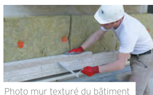
Photo mur texturé du bâtiment