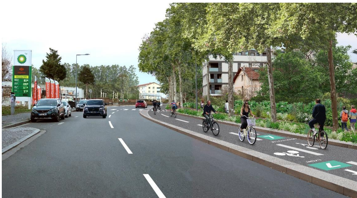
Perspective de la Voie Lyonnaise 7 sur le boulevard des Canuts à Lyon 4 e

Depuis la montée de la Boucle jusqu'à la station de métro Hénon, l'aménagement cyclable existant se situait sur le trottoir. Cette bande sera effacée afin que le trottoir soit réservé uniquement aux piétons et la Voie Lyonnaise 7 sera aménagée en piste bidirectionnelle sur la chaussée. Les travaux débuteront au début de l'année 2025.