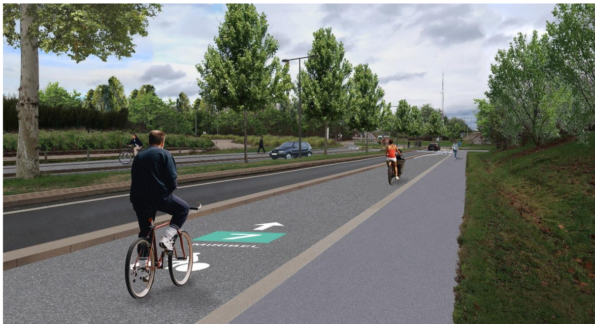
Perspective de la Voie Lyonnaise 7 sur la Route du Mas Rillier à Rillieux-la-Pape

Le passage de la VL7 par Rillieux-la-Pape se fera dans la continuité des aménagements existants, depuis l'avenue du général Leclerc en passant par la route du Mas Rillier jusqu'au rond-point proche de l'A46 avec une connexion à Neyron par le chemin de Sermenaz. La VL7 passera par le giratoire Charles de Gaulle dont les aménagements ont été récemment finalisés, et se connectera au futur quartier Ostérode. Ces travaux sont prévus à partir de l'automne 2024.