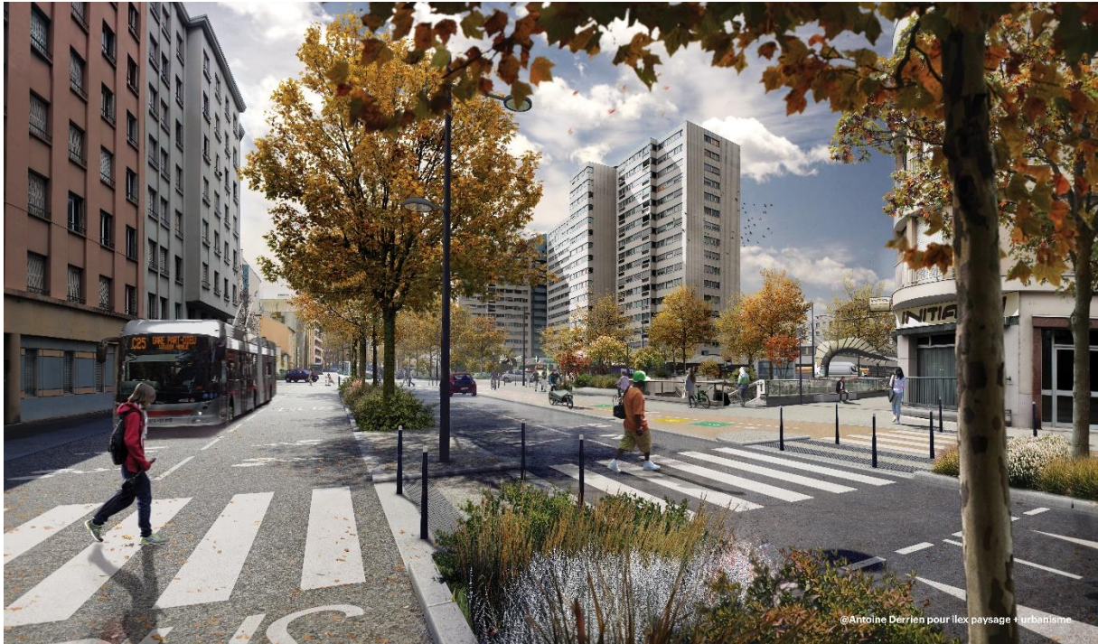
Perspective sur la future rue Garibaldi, au niveau de la station de Métro Garibaldi

La 3 ème phase du réaménagement inclut la plantation de 156 arbres, de 3 400 m 2 de bandes plantées, la réduction à 2 voies de circulation, l'installation de 114 arceaux vélos, la création d'une continuité cyclable avec la voie lyonnaise, et la requalification des places Rachais et Stalingrad. Le montant de l'opération est de 14,5 M € TTC et la livraison est prévue pour le printemps 2026.