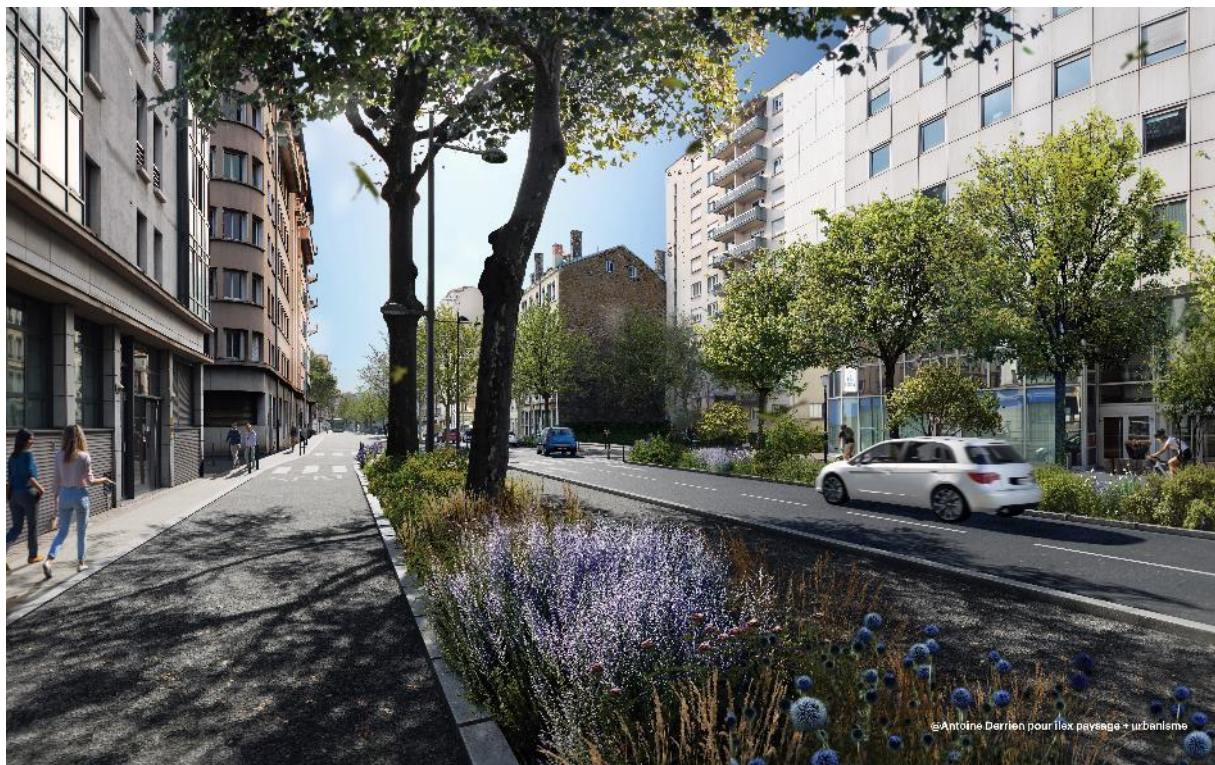
Perspective sur la future rue Garibaldi, au niveau de la rue de l'Abondance © Ilex