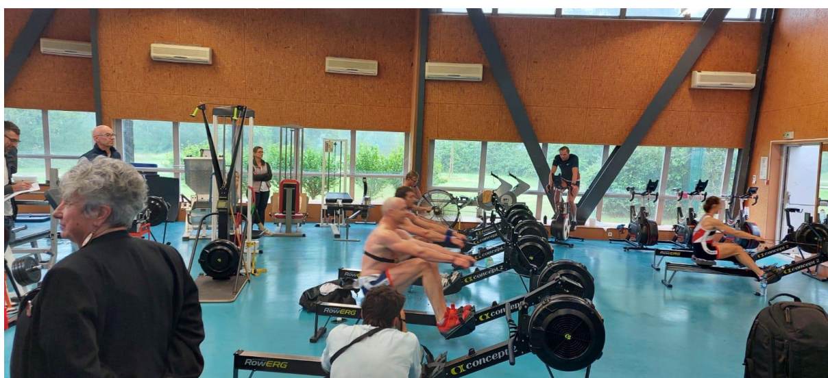
La salle d'entraînement du Pôle France Aviron de Lyon