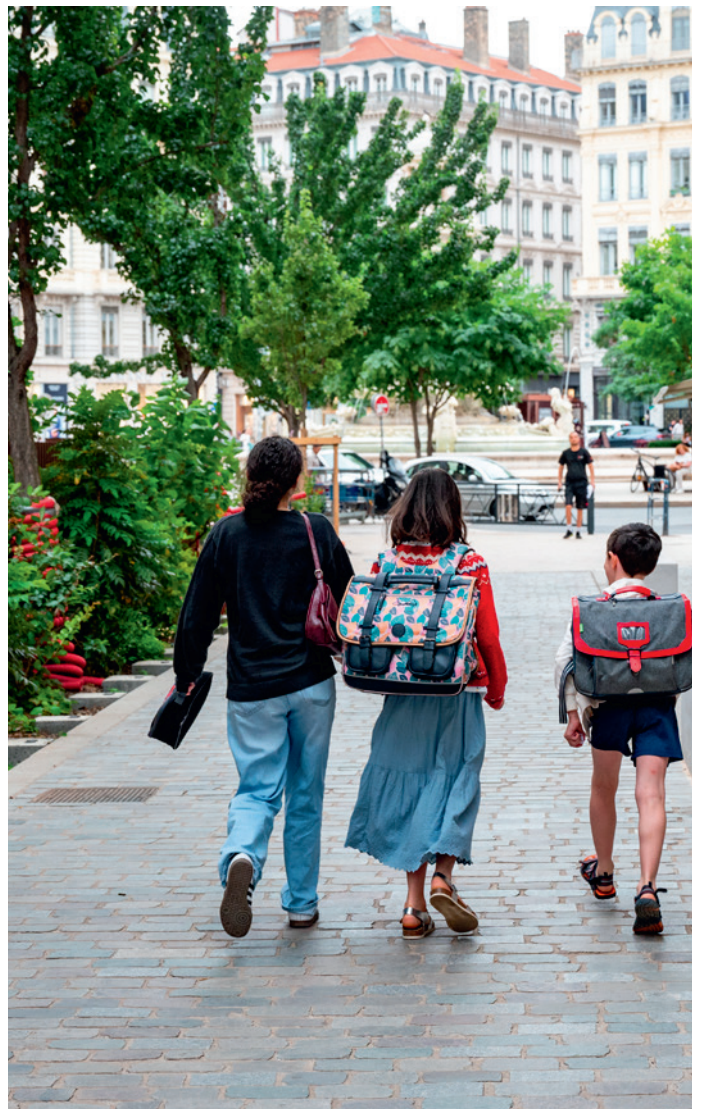
Rue Fabre, les aménagements sont finis