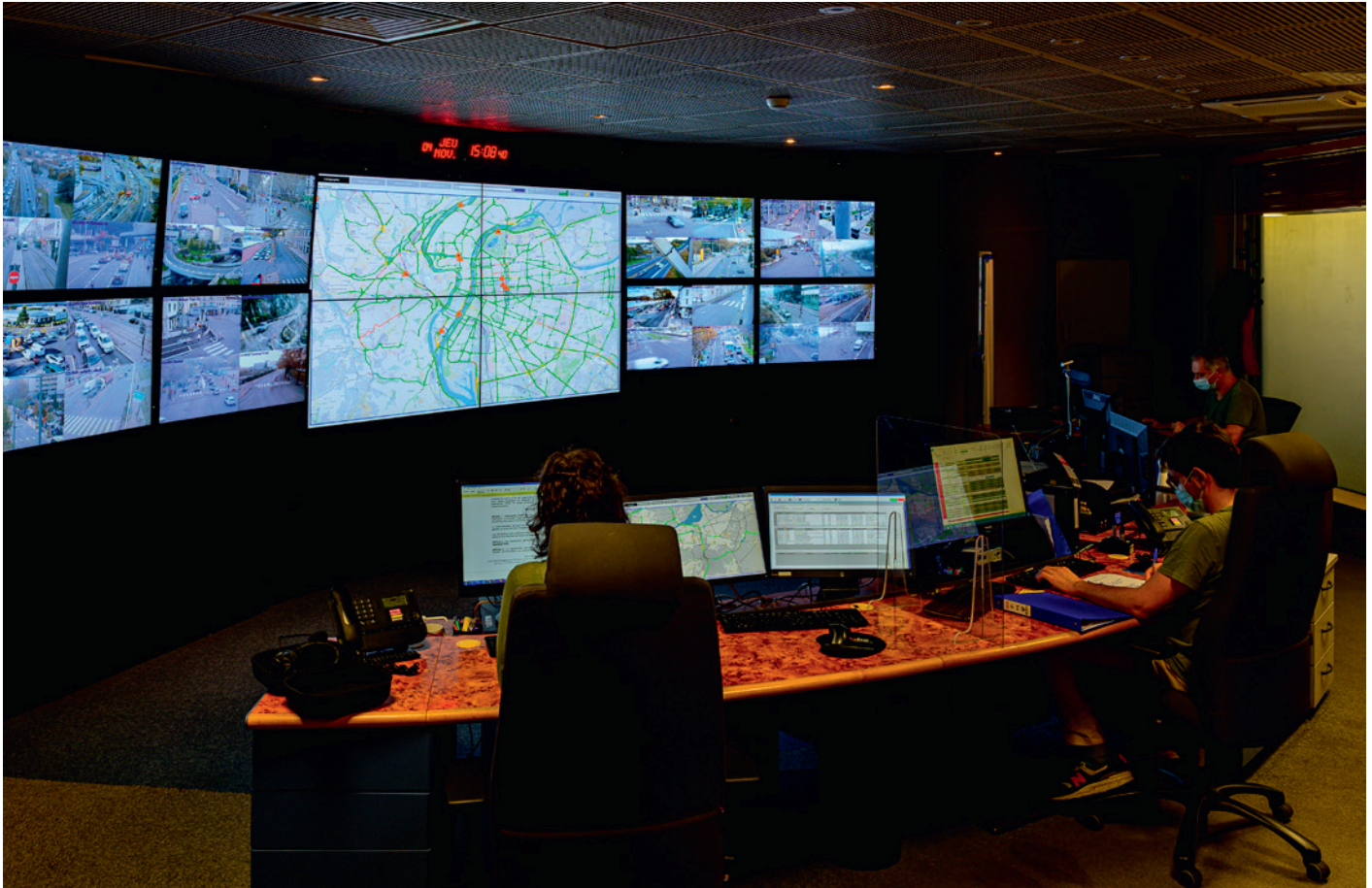
Le PC Criter