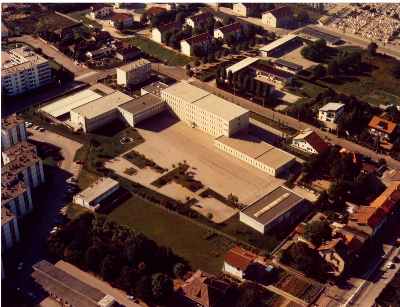
Le collège Alain vu du ciel en 1978

Un dispositif d'accueil des élèves est mis en œuvre durant les vacances scolaires, c'est L'École Ouverte. Sur des sessions de cinq jours, collégiens et élèves des écoles primaires sont encadrés sur de l'aide aux devoirs, des activités culturelles, artistiques ou sportives et des sorties culturelles ou sportives.