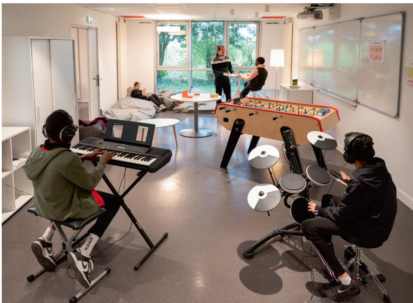
Collège Pierre-Valdo, Vaulx-en-Velin

Le total des subventions attribuées aux 16 collèges représente 541 000€ TTC.